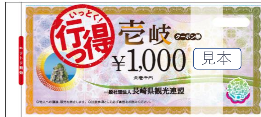
行っ得クーポン券