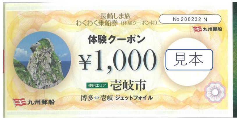
わくわく乗船券体験クーポン券